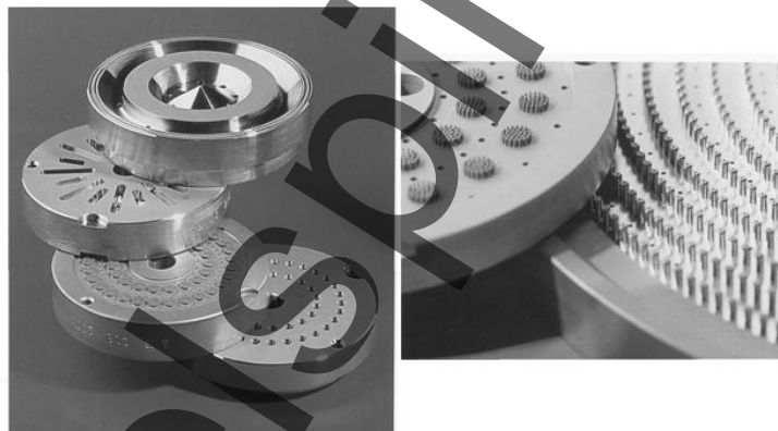
Рисунок 1 – Фильеры для формования синтетических волокон из расплава

Пример фильеры для формования синтетических волокон из расплава представлен на рисунке 1.